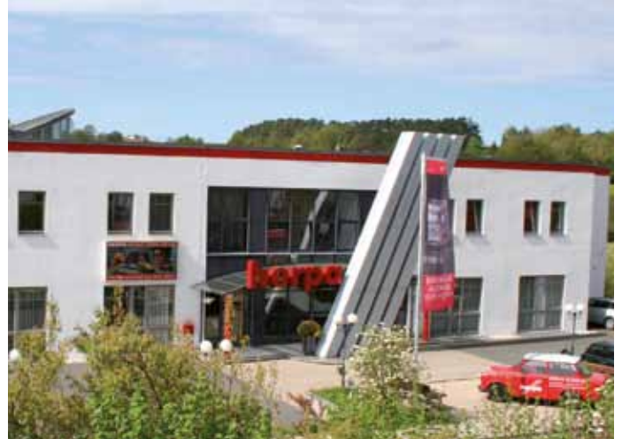
Herpa-Zentrale in Dietenhofen Herpa headquarter in Dietenhofen