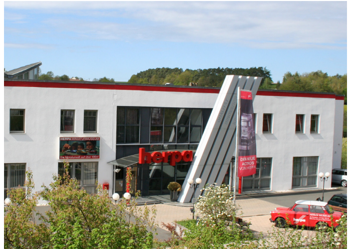
Herpa-Zentrale in Dietenhofen