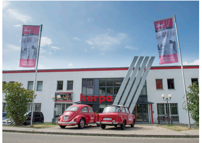
Herpa-Zentrale in Dietenhofen