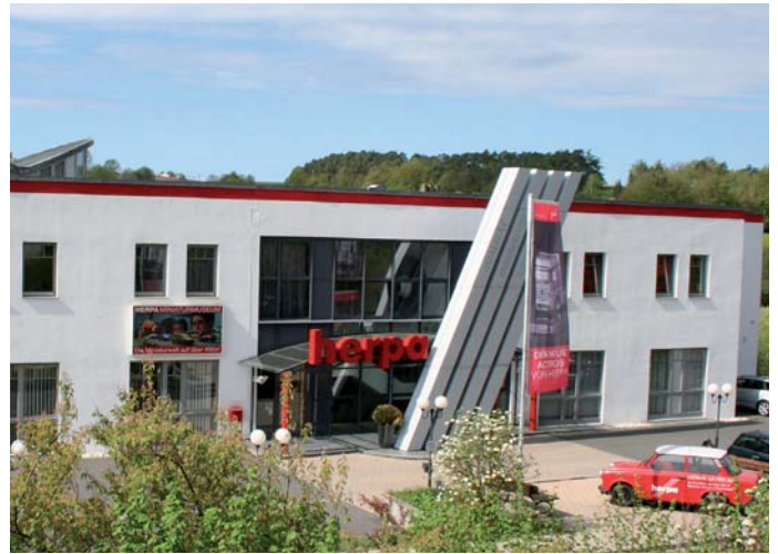
Herpa-Zentrale in Dietenhofen Herpa headquarter in Dietenhofen